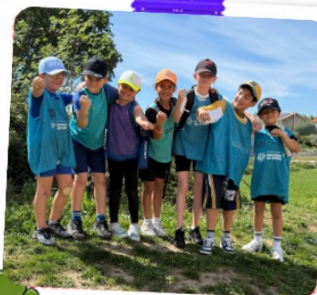
Sorties & plein air