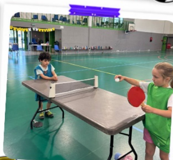
Sports & défis